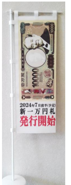
完成イメージ (市販のミニのぼり旗立てを使用)