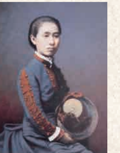
発行 埼玉ゆかりの3偉人を活かした3市連携PR会誌 (深谷市渋沢栄一記念館・本市文化財保護課・熊谷市妻沼中央公民館)