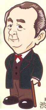
郷土の偉人 渋沢栄一