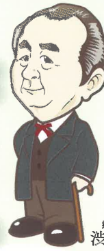
郷土の偉人 渋沢栄一