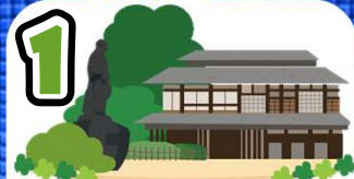
旧渋沢邸「中の家」 (血洗島247-1)