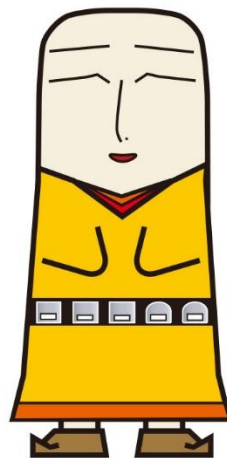
幡羅遺跡マスコットキャラクター ハラ君