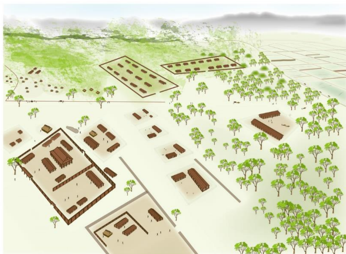
幡羅遺跡のイメージ