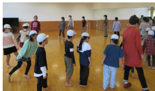
童謡リズム体操の会

10月23日(月)に、上柴西小学校2年生の児童たちが上柴公民館を訪れました。お部屋の見学をしたり、公民館団体のみなさんの活動を熱心に体験や見学をしていました。