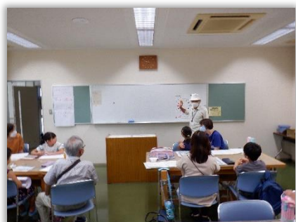
子どもお楽しみ会（絵画教室）