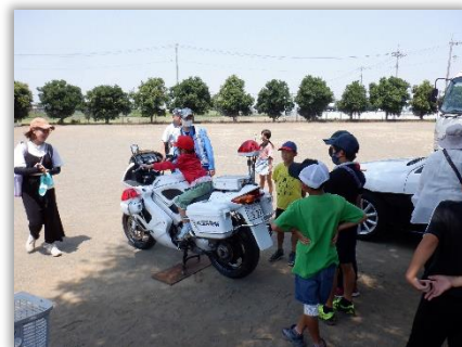
子どもお楽しみ会（交通安全教室）