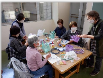
クラフトかご作り教室