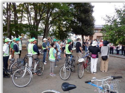
子ども安心安全パトロール