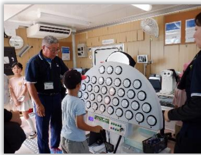
子どもお楽しみ会（交通安全教室）