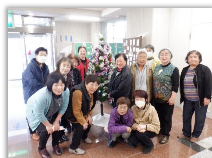
クリスマスツリー装飾