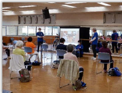
ふっかつ体操教室