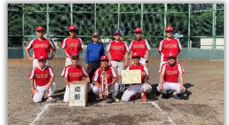
南下郷B (男子Bコート)