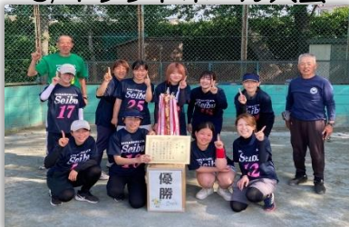
東方西部 (女子Cコート)