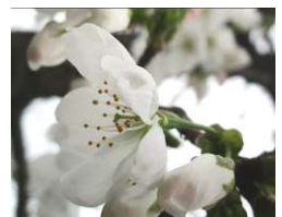
ヤマザクラ 昨年3月撮影

開花から散るまで約10日という桜は、散ってしまうと名残惜しくなります。暖かさとともにふくらむつぼみの変化を楽しみながら待つのもいいかもしれません。