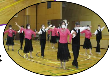
空手・社交ダンス パドル体操

4年ぶりに開催しました藤沢公民館まつりは、2月10日(土)・11日(日)、2日間にわたって延べ約4,200名のかたにご来館いただきました。日頃、サークル活動に励まれている皆さんの芸能・作品の発表を行い、盛りだくさんのイベントを通して地域の皆さんに交流していただきました。