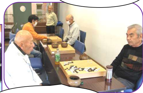
体験ですが…真剣です。