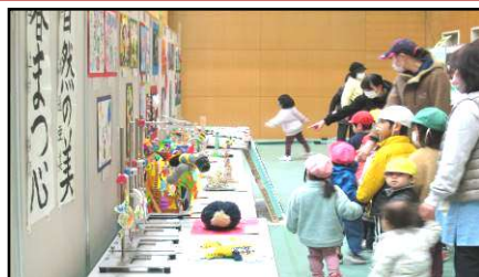
日本画・絵手紙 スケッチ・ 生け花!