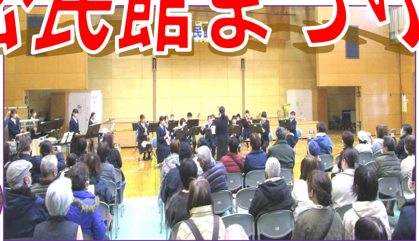
オープニングは藤中吹奏楽部!