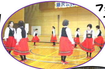
フォークダンス・ フラダンス