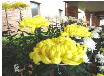
盆養は大菊の三本仕立て。見事！