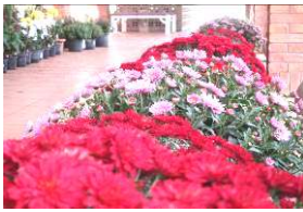
1株からたくさんの花をつけた小菊は、とても華やか。

藤白連の皆さんには、会場設営や水やり等でお世話になりました。ありがとうございました。