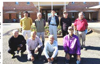
ボランティアの皆さん ありがとうございました。

11月8日(水)、ガーデニングボランティアの皆さんにより秋の花植え作業を行いました。 キンギョソウ、ピオラ、葉牡丹の花壇が出来上がりました。