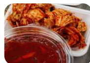
出来上がりのキムチ

キムチの材料を混ぜ合わせ切った野菜を加え、キムチの素づくりの工程を学びました。出来上がったキムチの素と先生が用意してくださった白菜漬けを混ぜ、試食も行いました。参加者からは、「思ったより簡単にできておいしかった。」「家でも作ってみたい。」との感想をいただきました。