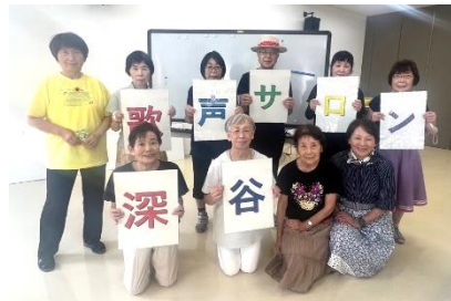
いつも元気で会場を盛り上げてくれる「深谷藍の会」のみなさん