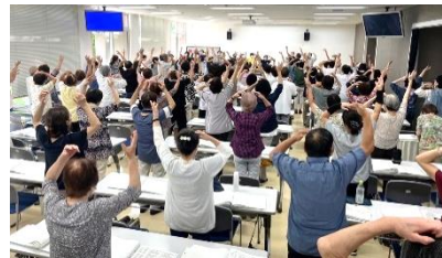
みんなで歌って踊って盛り上がっています

9月14日の歌声サロン内で埼玉県深谷警察署生活安全課と交通安全課より振り込み詐欺や空巣、交通事故の近況を伺い、だまされない方法やそれぞれの対策を教えてくださいました。