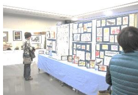
令和元年度公民館まつりの様子