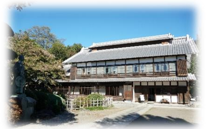
旧渋沢邸「中の家」(リニューアル後)