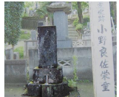
群馬県安中市南窓寺にある小野栄重の墓 (群馬県指定文化財)