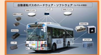
自動運転技術の導入に向けた取組の推進