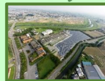
公共施設等への太陽光発電システム導入及びエネルギーの地産地消推進