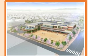
幼稚園・こども館複合施設の建設