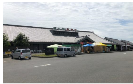
⑦ 道の駅 おかべ