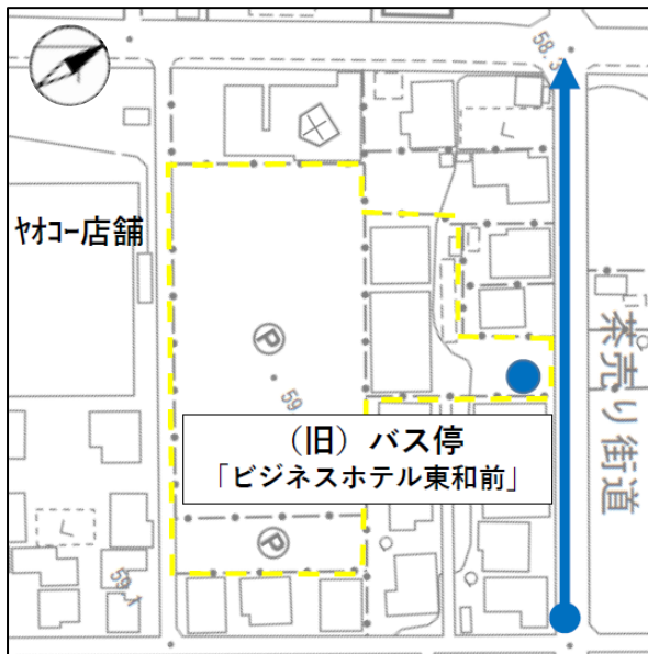
(現在の運行ルート・バス停位置)