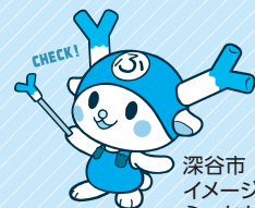
深谷市 イメージキャラクター ふっかちゃん