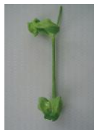
ひどく変形し原型をとどめない =3