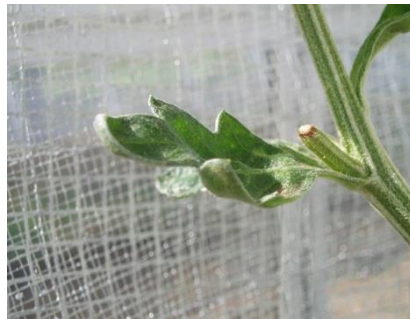
品目：きく 症状：葉の異常