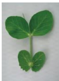
わずかにカップ状 =0.5