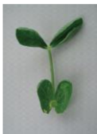
カップ状からさらに変形 =2