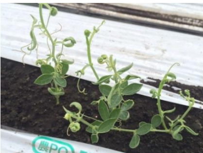
品目：スイートピー 症状：葉の異常