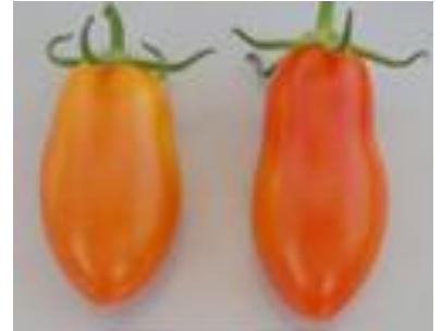
品目：ミニトマト 症状：果実が細長く変形