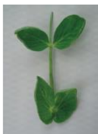
明らかにカップ状 =1