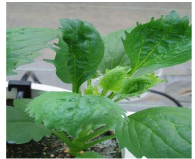
品目：アスター 症状：葉の異常