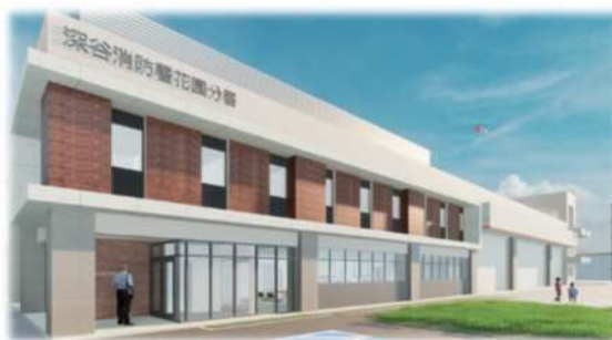
建て替え後の花園分署（イメージ）