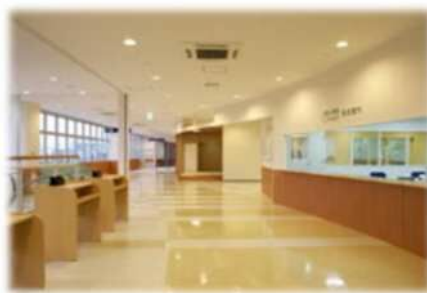
キララ上柴行政サービスセンター