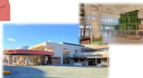
こどもふっかパークのオープン