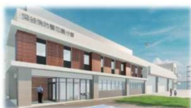
花園、上柴分署の建設