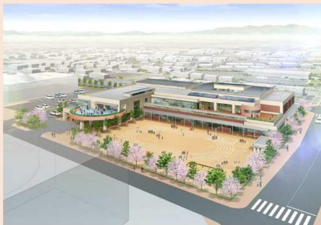
幼稚園・こども館 完成予想図