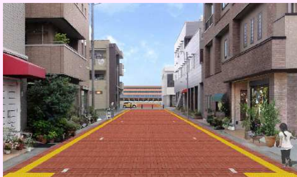
レンガ通り イメージ図