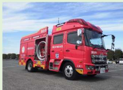
配備予定車両のイメージ