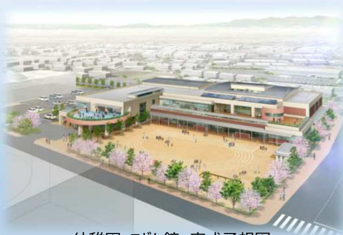
幼稚園・こども館 完成予想図