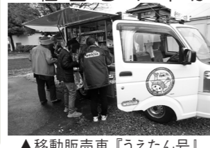
▲移動販売車「うえたん号」

毎週月曜日から金曜日の午後4時ごろまで(1力所当たり15~20分程度停留します。)