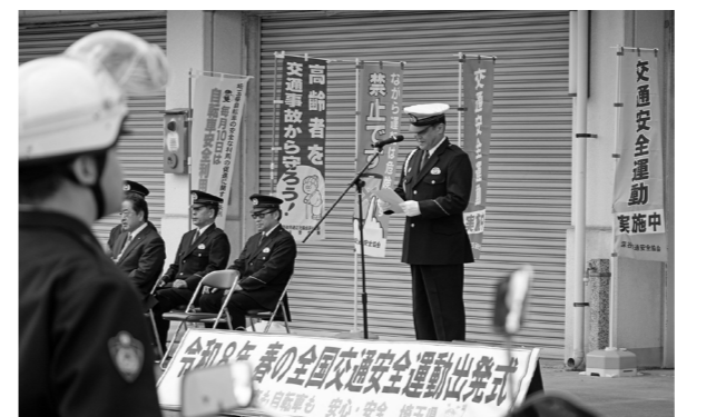
4月6日・深谷警察署 人も車も自転車も 安心・安全 埼玉県 『春の全国交通安全運動出発式』が開催され、警察署長からの交通事故防止への呼び掛けや、ドライバーに対する啓発活動が行われました。

市民プールから数えて52年という長きにわたり親しまれてきた『わんぱくランド』で、3月28日・29日の2日間、閉園イベントを開催しました。桜が咲く暖かな陽気の中、小さなお子さんから大人まで、2日間で4,735人が来場し、電動カゴランプリ、変わり種自転車レース、サーカスなどの催しのほか、キッチンカーなどの飲食販売を楽しみ、わんぱくランドとの最後の思い出をつくりました。長年にわたり、ご利用いただきありがとうございます。