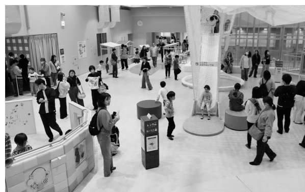
4月1日・子どもふっかパーク 待ちに待った『ふかパー』がオープン！ 深谷市子ども館『子どもふっかパーク』が4月1日にオープンしました。多くの子どもと保護者が訪れ、『ふかパー』にたくさんの笑顔と笑い声があふれました。