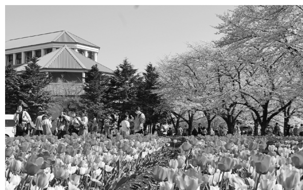
4月3日・深谷グリーンパーク・パティオ 満開の桜とチューリップが共演 深谷市の花であるチューリップが色鮮やかに開花し、満開に咲く桜との共演が実現しました。多くの来場者が笑顔で写真撮影やピクニックを楽しみました。