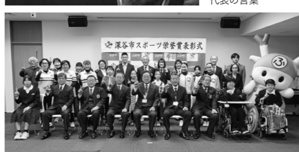
3月25日・市役所本庁舎 深谷市スポーツ栄誉賞表彰式 国際的・全国的な競技大会で優秀な成績を収めた方々に贈られる深谷市スポーツ栄誉賞の表彰式を開催し、令和7年度は28人のかたが受賞されました。