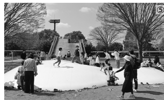
左上から時計回りに(写真①)来場者でにぎわう管理棟前(写真②)スタート直前の変わり種自転車レース(写真③)エアートランポリン(ふあふあふっかちゃん)前でふっかちゃんと記念撮影(写真④)市民プール開業当時の写真を展示(写真⑤)ふわふわドームを楽しむ子どもたち