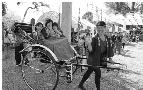
3月28日・瀧宮神社 春の訪れを楽しむ『ふかや桜まつり』 ぼかぼかした陽気の中でふかや桜まつりが開催され、来場者は、桜をイメージして頭上に吊り下げた傘(アンブレラスカイ)や人力車などを楽しみました。