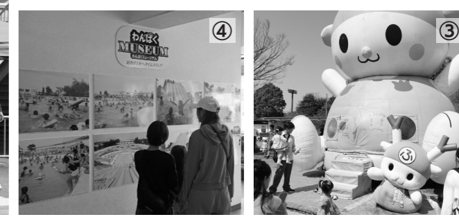
3月28日・仙元山公園遊園地わんぱくランド たくさんの思い出をありがとう『Grand Finale わんぱくランド』

市民プールから数えて52年という長きにわたり親しまれてきた『わんぱくランド』で、3月28日・29日の2日間、閉園イベントを開催しました。桜が咲く暖かな陽気の中、小さなお子さんから大人まで、2日間で4,735人が来場し、電動カゴランプリ、変わり種自転車レース、サーカスなどの催しのほか、キッチンカーなどの飲食販売を楽しみ、わんぱくランドとの最後の思い出をつくりました。長年にわたり、ご利用いただきありがとうございます。