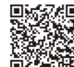
▲接種券発行申請(電子申請)

なお、②、③に該当するかたで接種を希望する場合は接種券の発行申請(電子申請またはコールセンターで申し込み)が必要です。