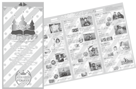
▲講座参加者の想いを紹介するパンフレット『ふかや農業☆シンデレラ』。マルシェなどの出店時に配布。

◆それぞれのストーリーを携えて女性農業者が拓く農業経営 近年、個々の好みに寄り添う販売方式や商品の背景を求める消費者が増えつつあり、消費者に近い視点を持った柔軟な販売戦略が求められています。 このような多様化したニーズに対応する担い手の育成を目指し、経営の発展に意欲的な女性農業者を募って次世代のリーダーを育成する「経営発展講座」を開催。活