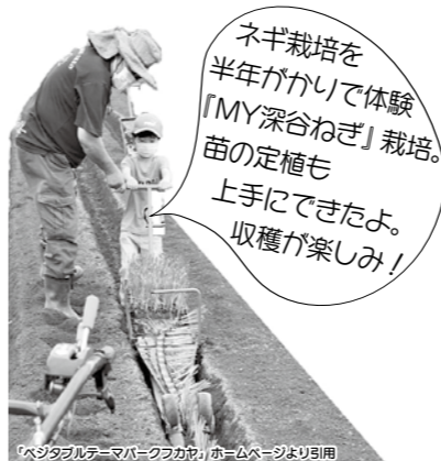
「ベジタブルテーマパークフカヤ」ホームページより引用

現在、約100の市内の生産者・飲食店・その他の分野の事業者の方々が『パートナー』として、野菜や農業の楽しさを市民や市への来訪者に伝えていきます(パートナーは随時募集中)。また、埼玉県を中心に活動する野菜ソムリエが『ふかやさいアンバサダー』となり、深谷市のおいしい野菜、レシピ、飲食店情報、生産者の魅力など、深谷市の野菜の魅力と楽しさを発信しています。