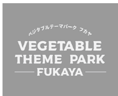
▲『ベジタブルテーマパークフカヤ』のロゴマーク

収穫体験をしたり、生産者から栽培方法を教わったり、飲食店で味わったり、お土産に買ったたりで、野菜は最高のレジャー。しかも、深谷市は都心から近いので、何度も訪れることができます。市では、市内を野菜のテーマパークに見立てて『ベジタブルテーマパークフカヤ』と名付け、野菜を楽しむまちづくりを推進中。