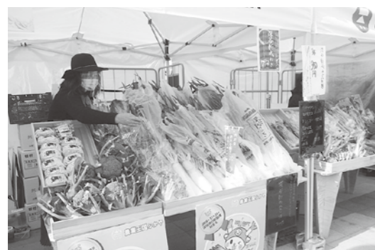
▲令和2年12月にオープンした東京都豊島区『イクサパーク』のファーマーズマーケットに出店。

躍の場へ向かう女性農業者の、想いや強みを生かした事業展開をサポートするため、講習会やマルシェの開催を案内しています。 従来は経営に携わることの少なかった女性農業者ですが、女性目線の商品開発や細やかな対応が、新たな可能性として注目を浴びています。 ◆市内外の消費者に直接PR! 講座の参加者は、深谷市役所で行われるマルシェのほか、県外のイベントにも参加し、こだわりの逸品を消費者に直接PR。皆さんの活躍とともに、深谷市の農業の可能性も広がっています。