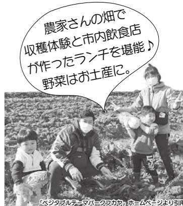
「ベジタブルテーマパークフカヤ」ホームページより引用

深谷市は、全国有数の農業産出額を誇り、中でもその半分以上が『野菜』です。野菜には旬があり、季節ごとの楽しみ方があります。また、健康志向も高まる中、野菜は日常的に取り入れたい食材の一つでもあります。野菜は深谷市の強みであり、人を魅了する力があるのです。