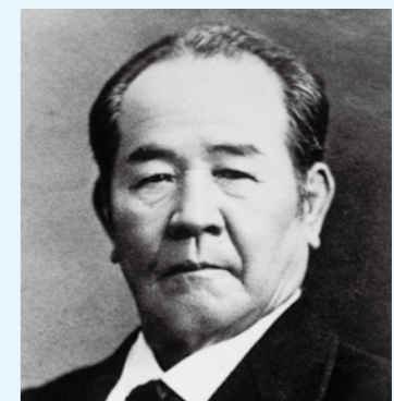
▲渋沢栄一肖像写真

『渋沢栄一肖像写真・ロゴマーク』を使用した 関連商品などの売上額と制作費用の集計を報告します