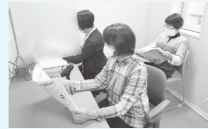
▲録音作業の様子。新型コロナウイルス感染症対策のパーティションも手作りしました。