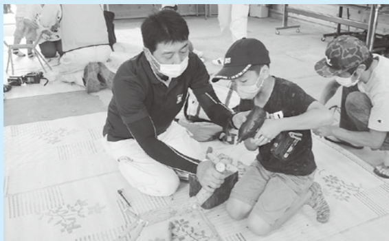
▲昨年度行われた教室の様子