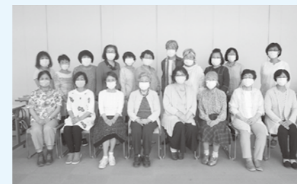
▲会員一同、楽しく活動しています。

私たちは、目の不自由なかに市の情報を音声にして伝えることを目的として、1975年に発足以来、50年近く活動をしています。