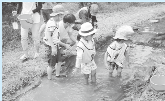
▲小川のどじょうをつかみどりしよう!