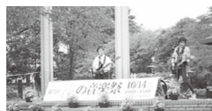
▲花の音楽祭の様子

とき 10月30日(休)午前10時～午後2時(雨天中止) ところ 深谷グリーンパーク(特設フラワーステージ) 定員 8組(応募者多数の場合は抽選) その他 電子楽器・音響装置(電源100Vまで) 申し込み・問い合わせ 7月15日(休)～8月31日(休)までに応募用紙をファクス(☎574-8611)または直接深谷グリーンパーク(☎574-5000)へ ※中止の場合は動画配信の予定