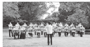
▲森の音楽祭の様子

とき 10月16日(休)午前10時～午後3時(雨天中止) ところ ふかや緑の王国(特設ステージ) 定員 20組(応募者多数の場合は抽選) その他 アコースティック(生音)演奏に限る 申し込み・問い合わせ 7月15日(休)～8月31日(休)までに応募用紙をファクス(☎551-5552)または直接ふかや緑の王国(☎551-5551)へ ※中止の場合は動画配信の予定