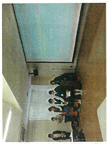
英語による体験発表