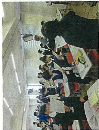
みんなでまとめ活動