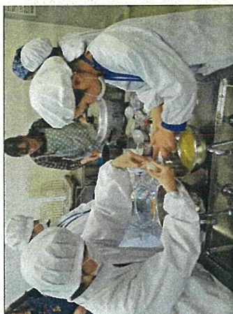
事前学習として料理で国際理解