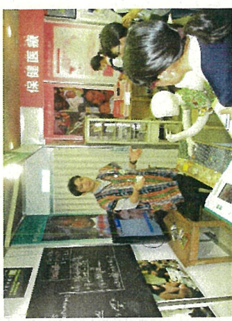
JICA地球ひろばでの体験