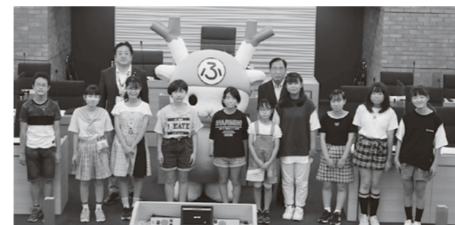
▲第1部（小学生の部・前半）の子ども議員