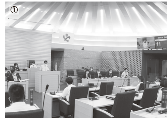
① 左上から時計回りに（写真①）中学生の部の議場内の様子（写真②）再質問をする小学生議員（写真③）質問に対する担当部署の答弁を熱心に聞く小学生議員たち

東京2020パラリンピックに送り出される『埼玉の聖火』が県内各所に分火され、深谷市ではゆかりの選手の紹介パネルとともに展示が行われました。