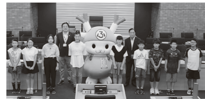
▲第2部（小学生の部・後半）の子ども議員