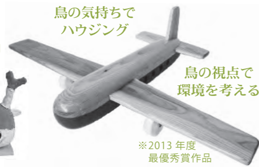
※2013年度最優秀賞作品

ジャパンバードハウスコンテストは、遊び心を大切に、鳥の視点で都市の環境を考え、人と人、人と自然とのコミュニケーションづくりを目指します。 募集部門 人間審査の部…デザインやアイデアを審査 鳥の審査の部…鳥が作品の中で巣作りから子育てまですると審査に加点 賞の内容 最優秀賞(1点) 賞金30,000円 優秀賞一般の部(1点)・小学生の部(1点)