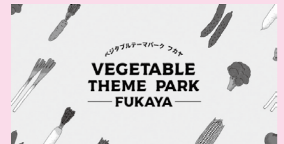
▲ベジタブルテーマパークのイメージイラスト。市内各所で構想の実現に向け、さまざまな取り組みを開始中です。

市内交流人口の増加と地域産業の活性化を図るため、深谷市の強みである野菜や農業を活用し、『深谷』が『野菜を楽しめるまち』というイメージを確立し、季節に応じて新たな発見をすることができるまちづくりを目指しています。