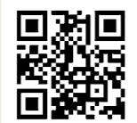
▲県歯科医師会ホームページ

県では、歯科衛生士による歯や口のことに関する相談や、通院が困難なかたのご自宅に伺う歯科医師を紹介する相談窓口を設置しています。制度など詳しくは、県歯科医師会ホームページをご覧ください。