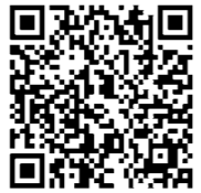
▲『第2次深谷市健康づくり計画』市ホームページ

ることが大切です。定期的に検診を受けることで、疾患を早期に見出し重症化を予防することができます。 ※『気になる深谷の健康データ』(右ページ下段)の数値など深谷市の現状と課題について詳しくは『第2次深谷市健康づくり計画』に記載しています。 計画の詳細は市ホームページ(下記QRコードからアクセス)で確認できます。