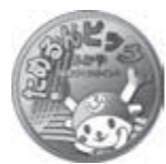
ためるんビッグふかや登壇