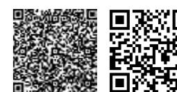
▲市ホームページ ▲厚生労働省ホームページ