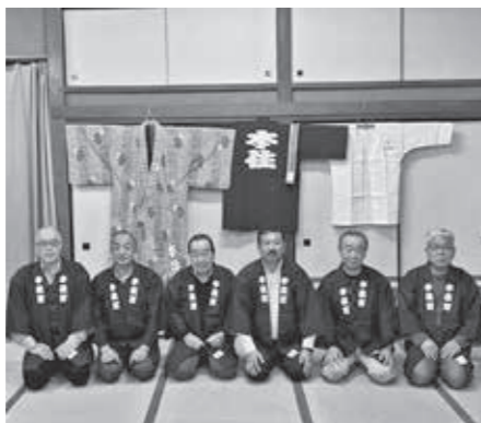
▲本住町自治会が整備した活動備品

本住町自治会が、自治総合センターの実施している宝くじ助成を受け浴衣や半天などのコミュニティ活動備品の整備を行いました。