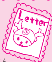
優秀賞 中学生の部 お父さんへ

「ありがとう。」この一言がどれだけ私を救ってくれた事でしょう。私が中学生の時、学校に行くことを思い悩んだ時がありました。その時、担任の先生が言ってくれました。「学校に来てくれてありがとう。」「手伝ってくれてありがとう。」とたくさんの「ありがとう。」を言ってくれました。そんなたった5文字の言葉が自分にとって救いの言葉となり、学校に行く勇気をくれました。この言葉のおかげで一歩踏み出せたと思います。勇気をくれたありがとうにありがとう。