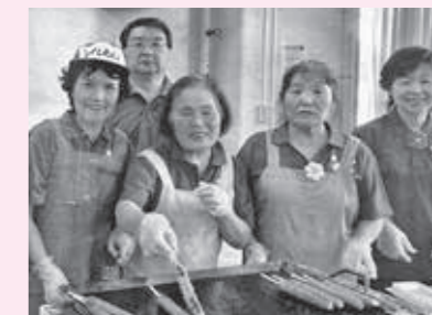
▲皆光園施設ボランティアの様子