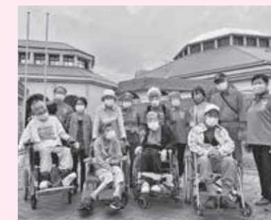
▲車椅子介助ボランティアの様子