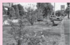
▲もみの木ガーデンの様子