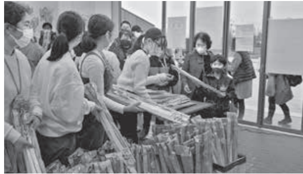
▲深谷市ジュニアリーダー(市内中学生)による『ねぎ束』配布が深谷テラスパークで行われました。