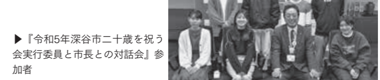
▶『令和5年深谷市二十歳を祝う会実行委員と市長との対話会』参加者

意見 JR深谷駅周辺に家族で遊べる施設ができれば、深谷のPRにつながると思います。 深谷市ではこども館の建設を計画していると聞きました。飲食ができたり、子どもが遊べる遊具を備えた屋内施設があれば、市のPRにつながり近隣からも深谷を訪れると思います。