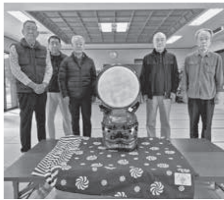
▲役員の方々と助成を受けて整備した獅子頭や太鼓

宝くじ助成 自治振興課 ☎574-8597 境東部自治会が、自治総合センターの実施している宝くじ助成を受け獅子頭や太鼓などのコミュニティ活動用品を整備しました。