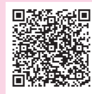
▲アプリの入手はこちらから(アプリは無料)

●全国版救急受診アプリ(消防庁作成アプリ「愛称「Q助」」) 急な病気やけがをしたとき、該当する症状などを画面上で選択していくと、緊急度に応じた必要な対応として「いますぐ救急車を呼びましょう」、「できるだけ早めに医療機関を受診しましょう」、「緊急ではありませんが医療機関を受診しましょう」または「引き続き、注意して様子をみてください」という文言が表示されます。ぜひ活用ください。