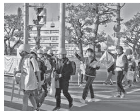
▲お迎えさんぽボランティアの皆さんに見守られて下校する児童たちの様子

今回の受賞をきっかけに、この活動に賛同して一緒に活動する人が増えれば、地域で子どもを見守る意識をさらに高められると期待するボランティアの皆さん。活動時の注意点を伺うと「見守り時は、横断