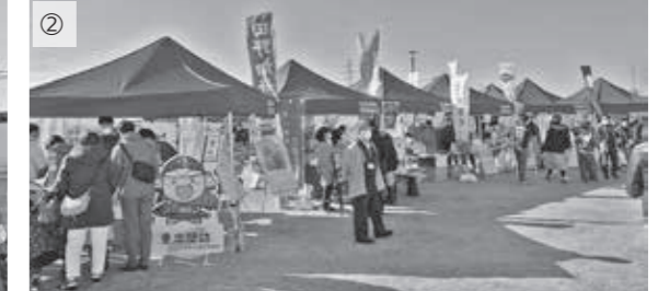
①PR合戦を行った重忠公ゆかりの地の各自治体首長および代表者とキャラクター ②重忠公ゆかりの地の自治体による、さまざまな物産品の販売や展示が行われました。