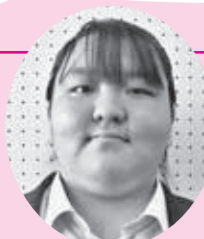
優秀賞 高校生・大学生の部 恩師へ