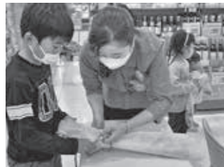
◀子ども向け『ねぎ束』のラッピング体験の様子。 ▼ラッピングしたネギを販売する市内スーパーの売場の様子。