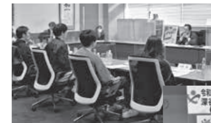
◀対話会で市政に対する意見を述べる実行委員たちの様子

参加した実行委員の皆さんは、若い世代の代表として、市が進めている計画やコロナ禍の問題などさまざまテーマについて市の取り組みや考え方を質問。市に対する思いや意見など活発な議論が行われました。