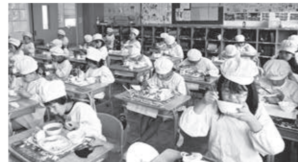
▲『重忠給食』を味わう川本南小学校の児童