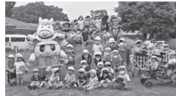
▲給食の前に重忠公について知ってもらおうと、川本南保育園に深谷市公式キャラクター『しげただくん』が遊びに来ました。

雨天で中止となった『出発式』に代えて、花園幼稚園内で園児が『交通安全宣言』と『パインポー体操』を披露し、各家庭向けに交通安全啓発グッズが配られました。