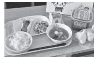
◀『重忠給食』の食材として、川本地区で作られた重忠みそと重忠にんにくが、使用されました。