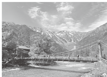
▲上高地散策ツアー

ワークメイト大里が行う、福利厚生事業のうち一部を紹介します。慶弔共済事業や補助事業など合計で40を超える事業があります。