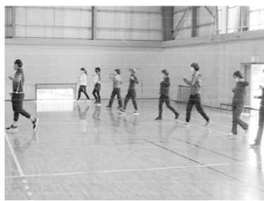
▲ウォーキング教室