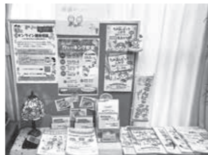
【登録店】鍼灸 養生堂 ☎501 - 2353 住所：大谷2840 - 2