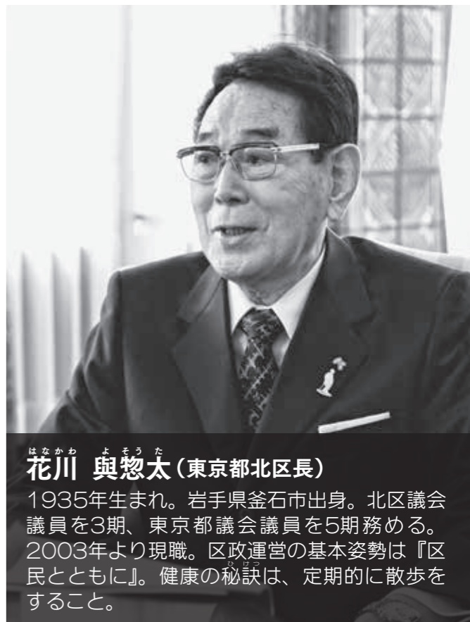
花川 與惣太 (東京都北区長)

1935年生まれ。岩手県釜石市出身。北区議会議員を3期、東京都議会議員を5期務める。2003年より現職。区政運営の基本姿勢は『区民とともに』。健康の秘訣は、定期的に散歩をすること。