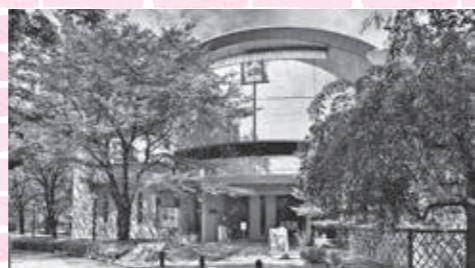
▲栄一翁の思想と行動を顕彰する渋沢青淵記念財団竜門社(現・(公財)渋沢栄一記念財団)の附属施設として昭和57年に飛鳥山公園の一部に設立された博物館。令和2年11月19日にリニューアルオープンを迎えました。