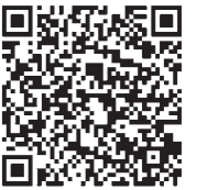
▲市ホームページはこちらからアクセス

すべてのワクチンの接種には、効果とリスクがあります。子宮頸がんワクチンの予防接種について詳しくは市ホームページをご覧ください。