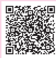
▲アプリの入手はこちらから(アプリは無料)

●全国版救急受診アプリ(消防庁作成アプリ「愛称「Q助」」) 急な病気やけがをしたとき、該当する症状などを画面上で選択していくと、緊急度に応じた必要な対応として「いますぐ救急車を呼びましょう」、「できるだけ早く医療機関を受診しましょう」、「緊急ではありませんが医療機関を受診しましょう」または「引き続き、注意して様子を見てください」という文言が表示されます。ぜひ活用ください。