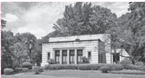
▲栄一翁の傘寿(80歳)と子爵に昇格したお祝いを兼ねて、大正14年に竜門社(現・(公財)渋沢栄一記念財団)が贈呈。国指定重要文化財。書庫として建設されたことから全体的に堅牢な建築となっています。