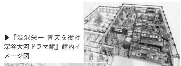
▶ 『浅沢栄一 青天を衝け 深谷大河ドラマ館』館内イメージ図 ◀ 『中の家』セットをドラマ館内に再現したイメージ図

問い合わせ 入場券販売管理センター 551-8955 『浅沢栄一 青天を衝け 深谷大河ドラマ館』が2月16日(火)に開館します。現在、当日券より2割引きで購入できる前売券をチケットぴあや各主要コンビニエンスストアのマルチメディア端末で販売中です。 【前売券販売期間】 2月15日(月)まで 【前売券販売価格】 大人(18歳以上)640円、小学生〜高校生320円 ※未就学児は無料