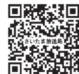
▲NHKさいたま放送局ホームページ

※新型コロナウイルスの感染状況や荒天などの影響により、公演中止や内容を変更する場合があります。