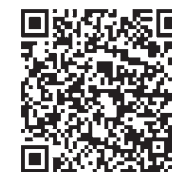
▲市ホームページはこちらからアクセス

すべてのワクチンの接種には、効果とリスクがあります。子宮頸がんワクチンの予防接種について詳しくは市ホームページをご覧ください。