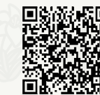
▲地域通貨ネギー取扱店ページ

右記QRコードを読み取ると市ホームページにアクセスできます。事前に確認のうえ、ぜひご利用ください。