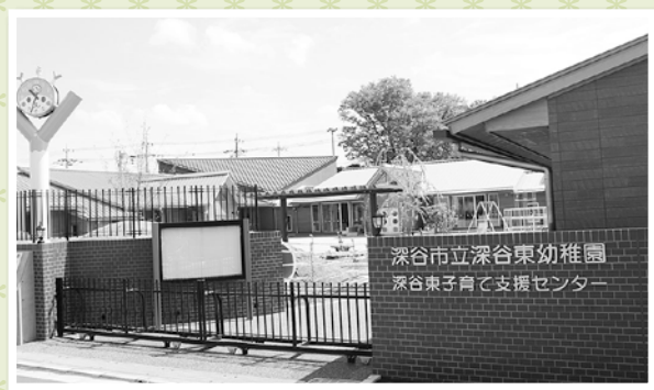
深谷市立深谷東幼稚園 深谷東子育て支援センター

▲園内の廊下にある『みんなの広場(写真左)』にやってきたよ。ここは、廊下の途中だけ、園のお友だちが仲良く集えるように広がっているんだって! ほかに、園内にはふっかちゃんがいっぱい! うれしいな~。