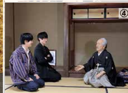
左上から時計回りに(写真①) 開場を楽しみに待つ観覧者 (写真②)『青天を衝け』で渋沢栄一役の吉沢亮さんと渋沢喜作役の高良健吾さんをゲストに迎えて行われた『土曜スタジオパーク』公開生放送の様子。(写真③) 深谷の郷土料理『煮ぼうとう』を味わう出演者 (写真④) 吉沢さんと高良さんが『中の家』の渋沢栄一アンドロイドを見学 (写真⑤)『深谷大河ドラマ館』を来訪した吉沢さんと高良さん。『青天を衝け』の由来となった栄一翁の詩『内山峡』の拓本前で撮影。