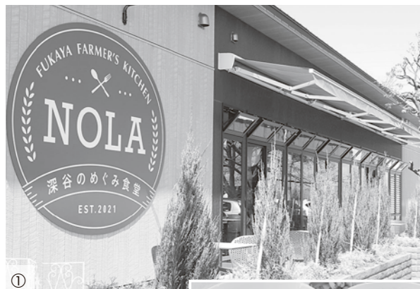
① (写真①) NOLA外観 (写真②) 各種煮ぼうとう (写真③) 店内の様子