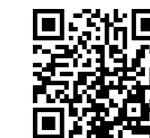
▲サングリーンパークホームページ