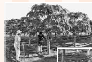
◀農場での作業の様子。収穫の頃合いを見計らいながら手入れをします。

主な作業内容としては、インターネットオークションへの出品、農作業、内職、リサイクル品の回収などです。インターネットオークションへの出品作業では、商品の特徴を書き出し、それをパソコンを使用して入力します。その後、商品が落札されると、梱包から発送まで行います。一見すると難しそうな