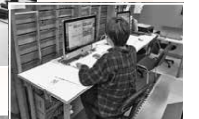
▲インターネットオークションへの出品作業の様子