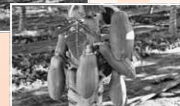
▲風林自慢の『青パパイヤ』。1個300円

作業内容ですが、職員のサポートのもと、楽しみながらゆとりを持って作業に取り組んでいます。