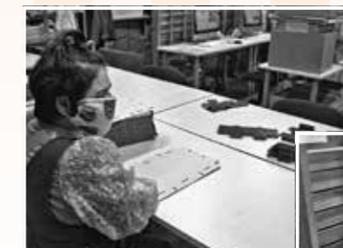
◀内職作業の様子。ひとつずつ丁寧に箱を作っています。