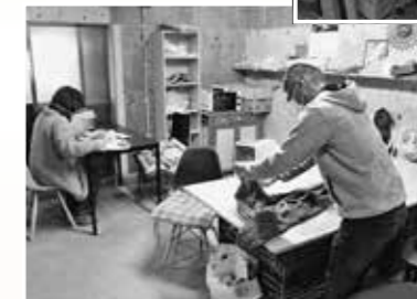
◀リサイクル品の仕分け作業の様子