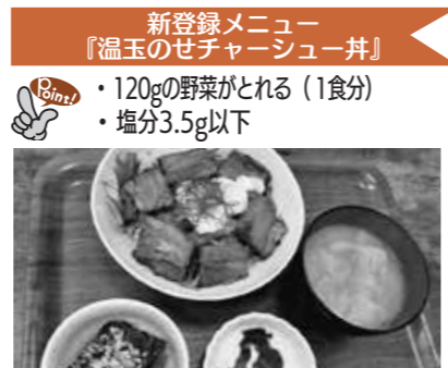
【メニュー登録店】すずき食堂(寿町1)

このたび、『健康づくり応援店』のヘルシーメニューに新たにメニューが登録されました。各店舗の登録メニューなどは、市ホームページで確認できます。また、保健センターとコラボレーションでヘルシーメニューを作りたい店舗はぜひ、お問い合わせください。