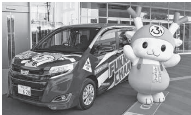
▲贈呈された『大ねぎジェット号』。車両は、ふっかちゃんデザインのラッピングがされ、遠くからでも目に留まります。

贈呈された『大ねぎジェット号』は、公用車として市内外を走り、ふっかちゃんを通じて深谷をPRします。