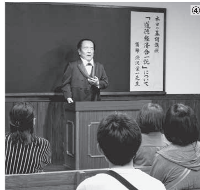
左上から時計回りに(写真①)『渋沢栄一アンドロイド除幕式』の様子(写真②)完成した渋沢栄一アンドロイドに帽子をかぶせる寄附者の鳥羽博道氏(写真③)館内見学などが再開した渋沢栄一記念館受付の様子(写真④)渋沢栄一アンドロイドによる講演に耳を傾ける来館者