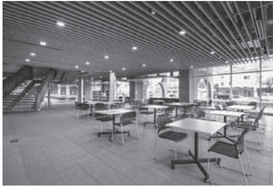
▲多目的ホール。休憩のみでも利用できます。

また、施設の特徴としては、メインエントランスから入った場所には『多目的ホール』となっており、休日も一般開放され、午前8時〜午後9時まで、誰でも利用できます。来庁者向けのFree WiFiを完備していますので、ぜひご利用ください。