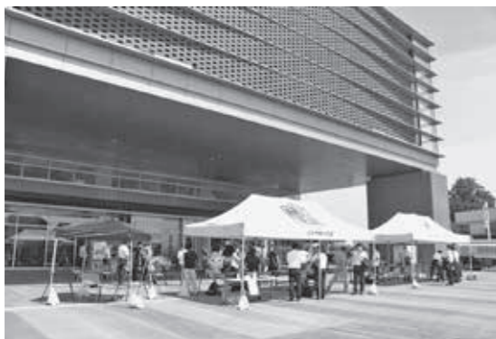
▲ピロティで開催されたイベントの様子。